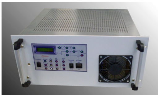
Wechselrichter 3,5kVA 110V DC 19" 5HE 460 mm tief IP20