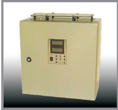
Gleichrichter 48V 15Amp Wandgehäuse B 400 H400 T 200mm IP20